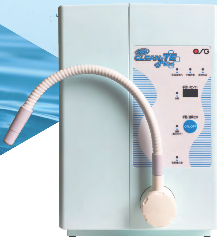
ハイクロソフト水生成装置

高度な衛生管理が求められる現場へ 「除菌力」と「使いやすさ」を兼ね備えた「ハイクロソフト水」です。